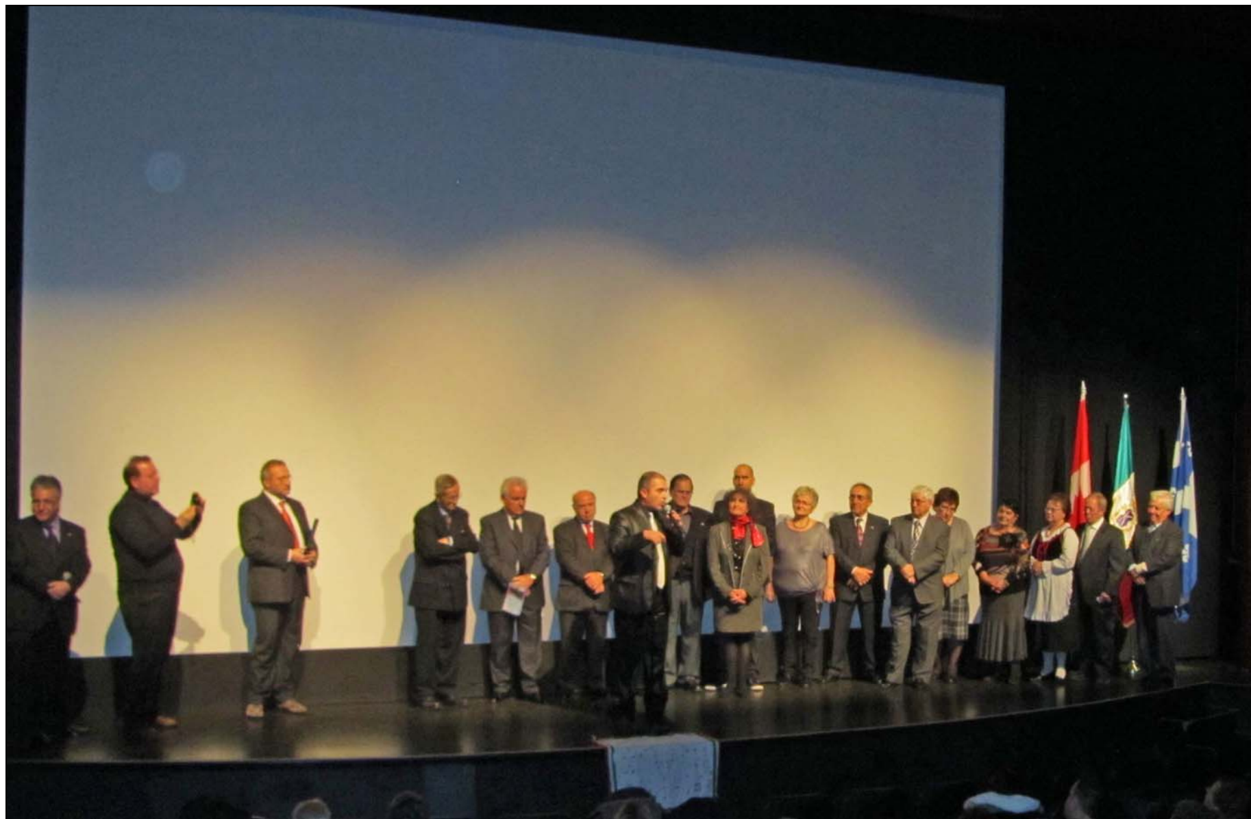
Al centro: Marco Gagliardi , Sindaco di Casacalenda saluta il pubblico